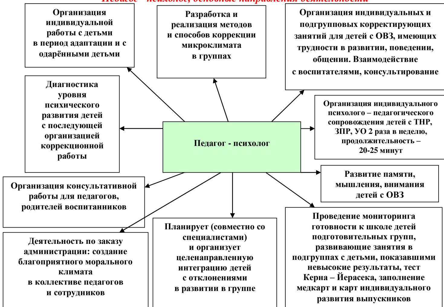
Рис. 2 «Педагог - психолог, основные направления деятельности»